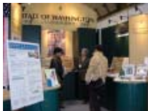
ワシントン州・EBPAのブース

SOHOで設計事務所をしている夫妻は、「新しい工法や材料を探しにきたのですが、知らないものが結構ありました」と。なかでも室内環境を左右する断熱技術には強い関心を寄せているようで、関連したブースでは熱心に質問していた。「断熱性を高めることは省エネルギーにもつながるので、地球環境という観点からも私たち設計者にとっては気になることです」というように、工法・構造もエコロジーにとって重要なファクターである。