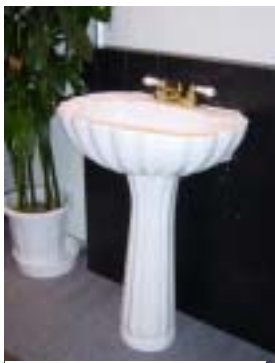
(CMに使用された陶器のシンク)

デザインされたパーツをセレクトし、それをコーディネートすることにより独特なデザインされた空間が生まれる。部屋という空間の中にちょっとしたパーツがあれば、それだけで十分その部屋のデザインを持つことが出来る。時計のCMにも登場したことがあるというヤスダプロモーションのデザインされた水栓製品は、今こだわりのある人の中でそのデザイン性と“カッコよさ”が受けている。