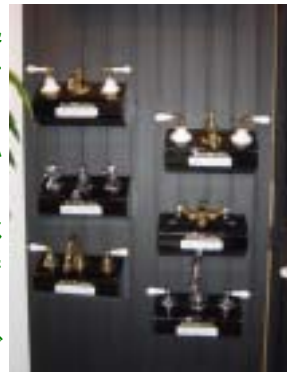
(同社の取扱製品の一部)

に不具合や故障を起こしており、大抵はそのパーツを交換すると修理が完了する。小さな部品ひとつからでも在庫対応する体制は、中小企業ならではといったところだ。またパーツのトラブル以外の不具合には、同社より水栓のプロが派遣され点検・修理を行う。社長自ら出向くこともある。